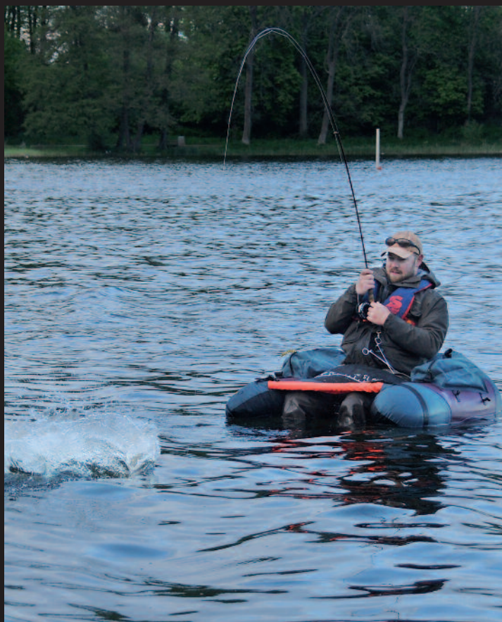
Her er der endnu en gedde, der faldt for en fristende flashflue.

DEN TRADITIONELLE FLASHFLUE , som består af en flash hale og en krop med flash spundet i en dubbingløkke og klippet til, holder 100%. Morten Valeur populariserede denne flue, der har gjort det